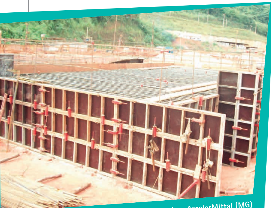
Fôrmas da Locguel na ArcelorMittal (MG)

responsabilidade do Consórcio Construcap/Ferreira Guedes/Toniollo Busnello. A obra tem por objetivo principal minimizar a seca no sertão nordestino. Atualmente, os trabalhos se concentram na construção de três túneis para escoamento das águas. Ao todo, serão 22 quilômetros de túnel na cidade de Cajazeira, sertão da Paraíba.