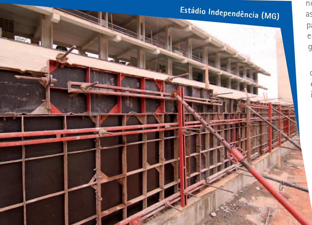
Estádio Independência (MG)

janeiro, plataformas Z45/25RT, responsáveis pelas montagens de pré-moldados no estacionamento. A expectativa é de que as obras de adequação final do Mineirão aos padrões exigidos pela Fifa sejam concluídas em dezembro de 2012, garantindo mais segurança, visibilidade e conforto ao torcedor.