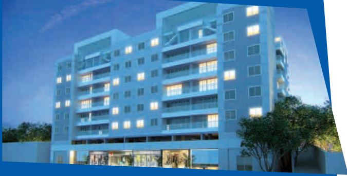
Residencial José Miguel Salomão (MG)