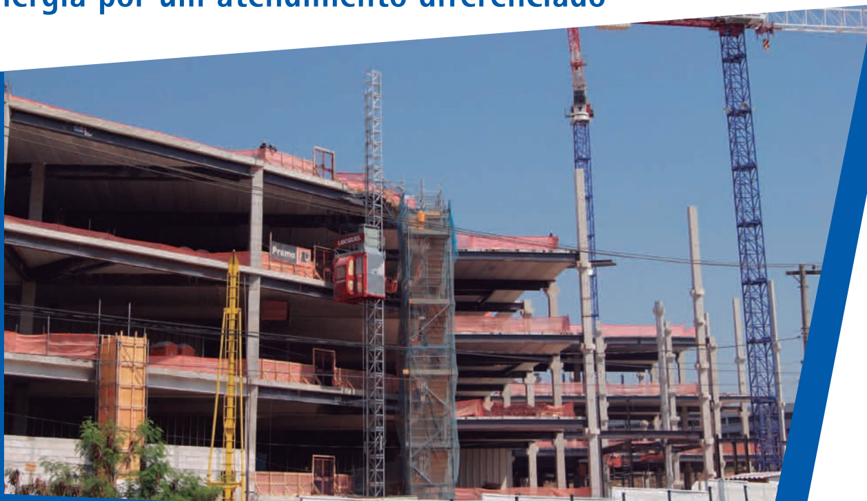
Shopping Estação BH (MG)

Certa vez, nos idos de 1500, o filósofo inglês Francis Bacon defendeu de forma simples e enfática: "A força unida é mais forte". Apesar de todas as mudanças vividas pelo mundo, o pensamento continua atual e válido como nunca - especialmente na forma de atuação do Grupo Orguel. Um dos exemplos são os trabalhos na construção Shopping Estação BH. Iniciada no primeiro semestre de 2011, a obra será concluída em 2012 e conta com a colaboração de sete empresas do Grupo: Orguel, Mekan, Locguel, Locbras, Orguel Plataformas, Mecanflex e Locguel Fôrmas que se beneficiam da sinergia propiciada pela simultaneidade da atuação e transformam essa sinergia em benefícios para o cliente.