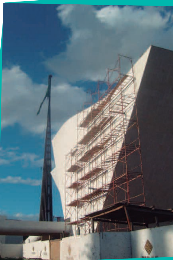
Panteão da Pátria (DF) com andaimes da Locguel

A Orguel, por sua vez, segue atuando nas obras de transposição do Rio São Francisco. Desde 2009, a empresa disponibiliza geradores de 100 e 500 kva para os trabalhos, que estão sob a