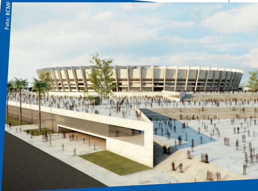
Perspectiva do Estádio Mineirão (MG) após o término das obras