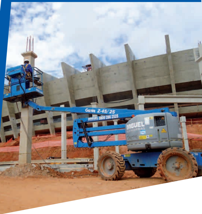
Estádio Mineirão (MG)

Um exemplo é a presença das empresas do Grupo nas obras de uma das principais sedes da Copa: o Estádio Governador Magalhães Pinto, o Mineirão, em Belo Horizonte. A Orguel, a Locguel, a Locbras e a Orguel Plataformas participam dos trabalhos, disponibilizando equipamentos e realizando trabalhos in loco . A Orguel, desde julho de 2011, disponibiliza compressores e martelos pneumáticos; a Locguel, desde outubro, oferece elevadores de cremalheira, além de balancins elétricos e manuais; a Locbras, por sua vez, atuou em duas etapas: a primeira, iniciada em 2010, com a locação de rompedores para a recuperação da estrutura externa do estádio; a segunda, no primeiro semestre de 2011, com a execução de serviços de furos para as instalações dos sistemas de amortecedores das arquibancadas. A mais recente novidade foi o início da atuação da Orguel Plataformas nos trabalhos. A empresa disponibiliza, desde