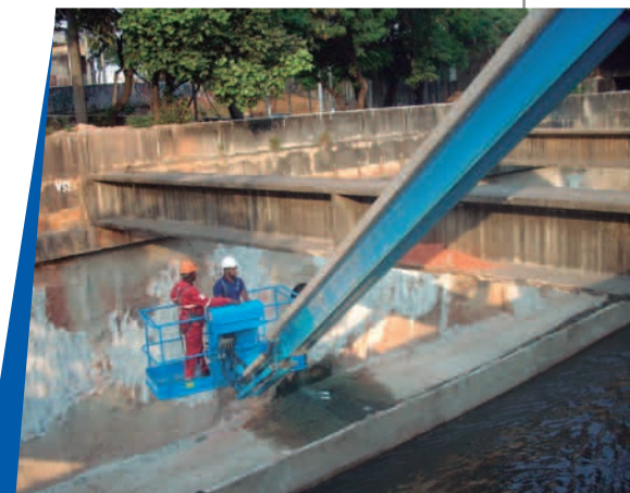
Boulevard Arrudas (MG)

A obra visa à revitalização urbana do local, com um completo tratamento paisagístico e implantação de ciclovias, além da criação de corredores exclusivos para os veículos do tipo Bus Rapid Transit (BRT), ou ônibus de trânsito rápido. A Orguel Plataformas disponibiliza plataformas de elevação nos modelos Z-45/25 RT (15 metros) e Z-80/60 (26 metros) para os trabalhos. Já a Multiclean oferece Hidrojateadoras de alta pressão. Sob responsabilidade do Consórcio Boulevard (Mendes Junior Trading e Engenharia/Via Engenharia), a obra tem duração prevista de um ano.