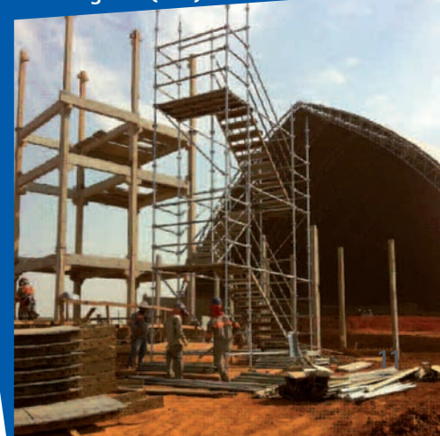
Armazém da Vale, em Araguari (MG)

Já no Rio de Janeiro, a Mecanflex participa da construção do Superporto do Açú. Maior empreendimento porto-indústria da América Latina, o superporto movimentará cerca de 350 milhões de toneladas por ano, entre exportações e importações, tornando-se um dos três maiores complexos portuários do mundo. A Mecanflex fornece andaimes multidirecionais, utilizados nos trabalhos de acabamento de superfície de alvenaria e pintura das subestações elétricas.